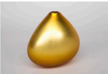
Thomas Blank, 2010, „Buuregoud“, Glasgefäß