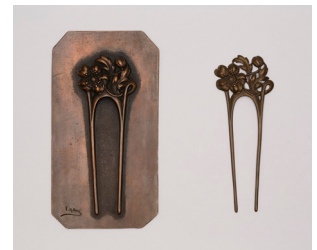
Haarschmuck mit Guss- model, Schülerarbeit der „Gravierschule Technikum Biel“, 1900