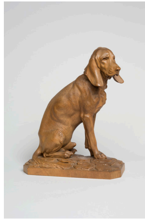
Hans Huggler-Wyss, um 1909, geschnitzter Jagdhund